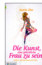
GANZ SCHÖN WEIBLICH „Die Kunst, eine glückliche Frau zu sein“ von Katrin Zita, Goldegg, 19,95 Euro